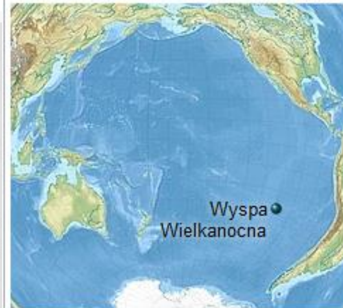
Położenie na mapie Oceanu Spokojnego

Wyspa Wielkanocna ma zaledwie 163 km 2 powierzchni pokrytej wulkanami i górami, wysepka należy do najbardziej odizolowanych miejsc na Ziemi. Od stałego lądu, czyli zachodniego wybrzeża Chile, dzieli ją niemal 4000 km, zaś od najbliższej położonej, maleńkiej wysepki Pitcairn prawie 2000 km. Na mapie świata stanowi niewielki punkcik na tle bezkresnego błękitu Oceanu Spokojnego. Europejczycy, a konkretnie Holendrzy pod dowództwem Jakuba van Roggeveena, odkryli ją w niedzielę wielkanocną w 1722 r. i prawdopodobnie stąd właśnie pochodzi jej nazwa.